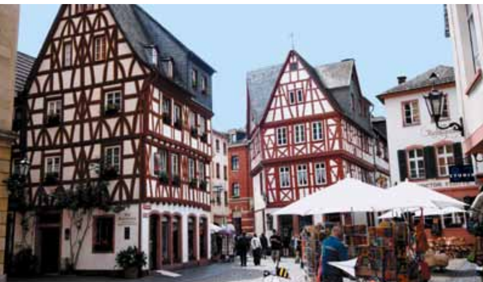
Altstadt: Fachwerkhäuser prägen die Innenstadt